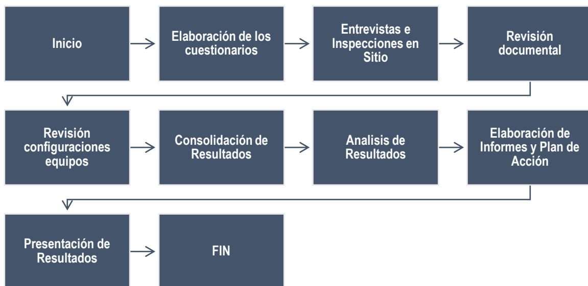
Ilustración 2. Metodología Recomendada GAP ISO 27001

A continuación se presenta una descripción de los pasos que se recomiendan realizar para el análisis GAP (análisis de brecha) con relación a la NTC/ISO 27001:2013 y el MSPI. El GAP considera los diferentes dominios de la NTC/ISO 27001:2013 con el fin de evaluar la brecha faltante para cumplir totalmente con estos modelos. Para mayor información contactar info@sisteseg.com .